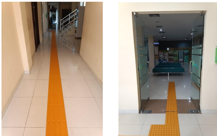
Gambar 3 : Jalur Disabilitas