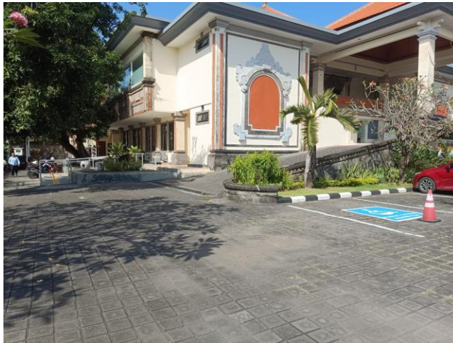
Gambar 4 : Akses Parkir Disabilitas