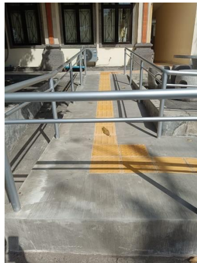
Gambar 1: Akses Jalan