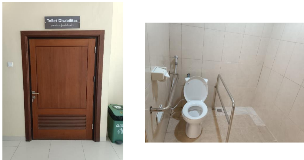
Gambar 2 : Toilet Disabilitas