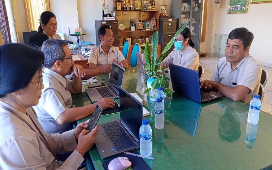
Foto Kegiatan Audit Mutu Internal