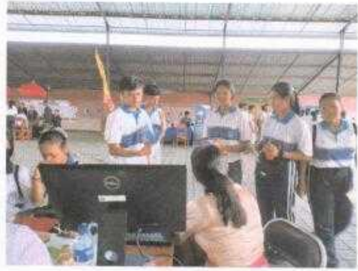
Tanggal 27 Oktober 2023